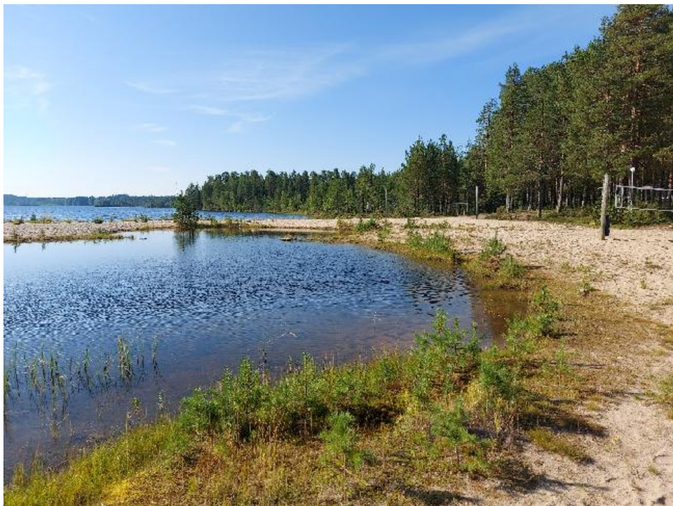
Lasten uimapaikan vesi ei pääse vaihtumaan, pohja on liettynyt ja rannoille tullut kasvillisuutta.