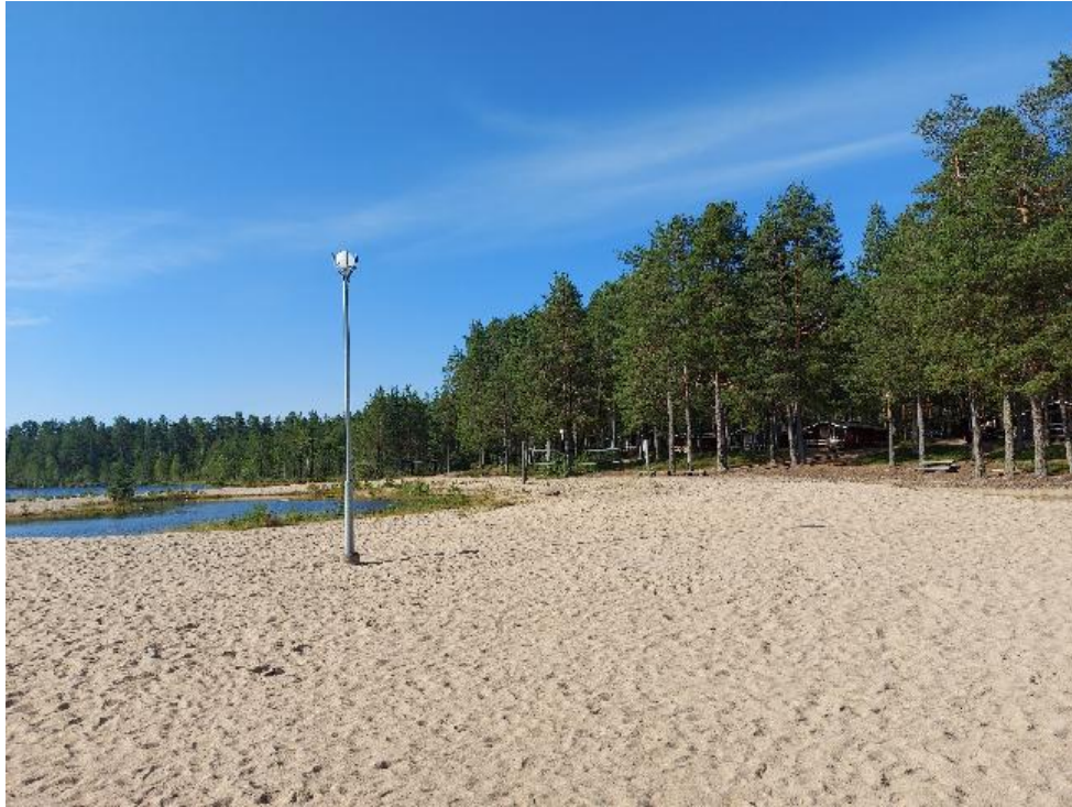
Vonkan alueen hiekkaranta, rantalentiskenttä ja lasten uimapaikat.